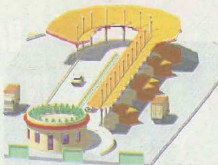
Il progetto della stazione ecologica